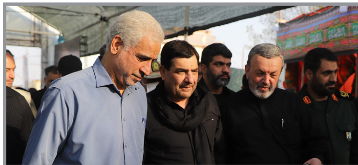
نخست وزیر عراق انجام دادم، برخی از مسائل مرتفع شده به نحوی که در حال حاضر فرایند کنترل گذرنامه با سرعت و بدون معطلی انجام می شود.

وی افزود: خوشبختانه در پایانه‌های مرزی روند کمک به طرف عراقی و ارائه خدمات رفاهی به آن سوی مرز آغاز شده است و با مذاکره تلفنی که روز گذشته با